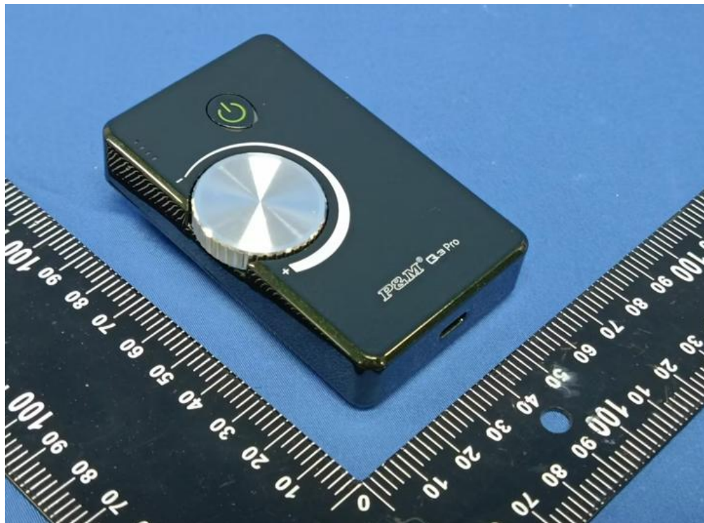
图 1 产品外观