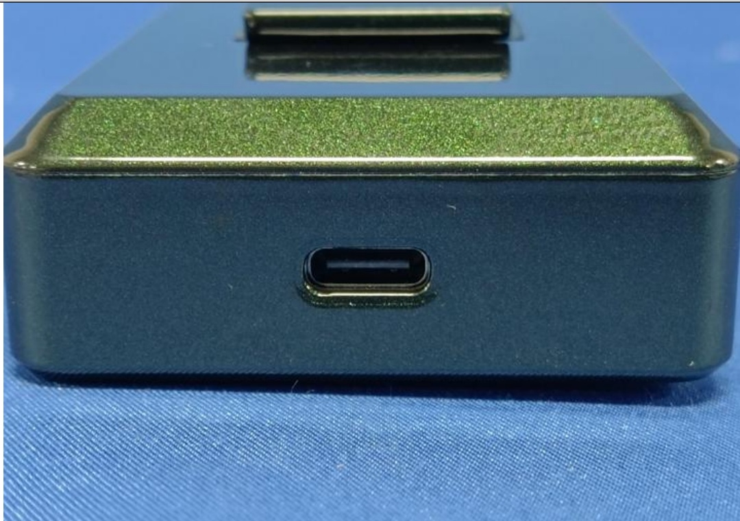
图 3 电源输入端口